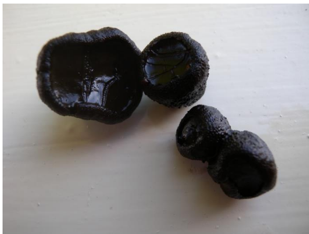
Bulgaria inquinans

Alain, Guillaume, Philippe, Michel et les autres ont œuvré ensemble pour une détermination finalement pas si facile. Les accros ont emporté des devoirs à la maison, lesquels ont permis de rajouter à la liste Inonotus rheades (= Xanthoporia radiata ), Skeletocutis nivea , Peziza ampelina et Bulgaria inquinans . Pour cette dernière espèce, à remarquer les asques qui ne contiennent que 4 spores arrivant à maturité, les 4 autres dégénérent.