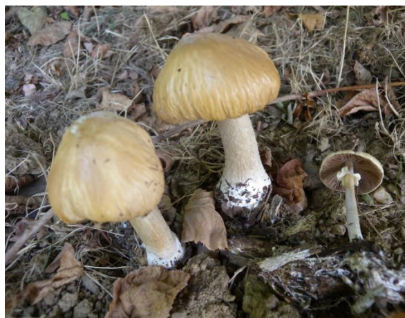
Agrocybe rivulosa

Alain, Guillaume, Philippe, Michel et les autres ont œuvré ensemble pour une détermination finalement pas si facile. Les accros ont emporté des devoirs à la maison, lesquels ont permis de rajouter à la liste Inonotus rheades (= Xanthoporia radiata ), Skeletocutis nivea , Peziza ampelina et Bulgaria inquinans . Pour cette dernière espèce, à remarquer les asques qui ne contiennent que 4 spores arrivant à maturité, les 4 autres dégénérent.