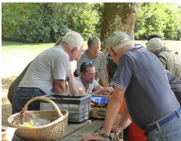
Concentration maximum !

Bien sûr, par ces temps de sécheresse extrême, les participants ne s'attendaient pas à une récolte abondante sur cette propriété du département pourtant souvent riche en découvertes mycologiques. La quantité, en effet, n'y était pas mais quelques trouvailles valent tout de même d'être notées. Un bon travail collaboratif a déjà permis d'identifier plus de 25 espèces au cours de la séance qui a suivi le pique-nique. Ainsi a été identifié Agrocybe rivulosa , nouvelle espèce rare venant sur la sciure, le paillage ou le fumier.